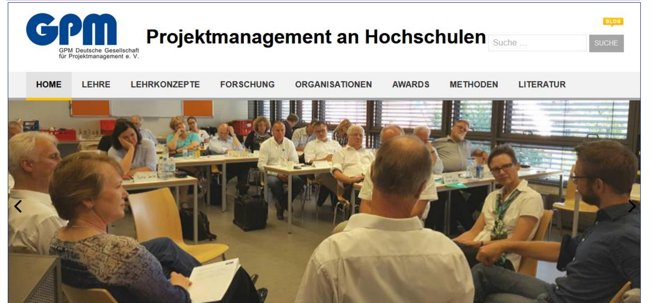
Das Projektmanagement-Portal für Hochschulen und Wissenschaft

DIE wissenschaftliche Plattform zum Projektmanagement an Hochschulen