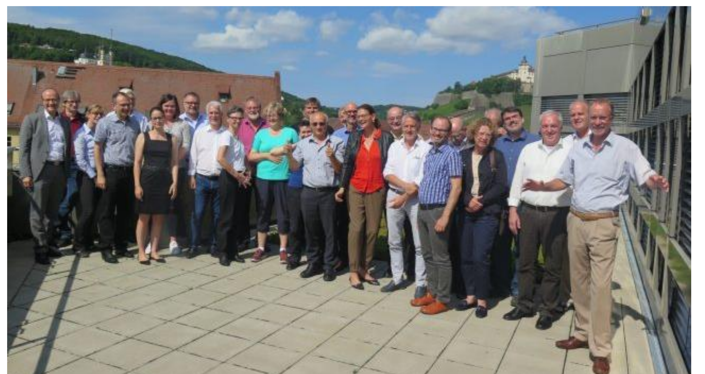
Juli 2017: HS Würzburg