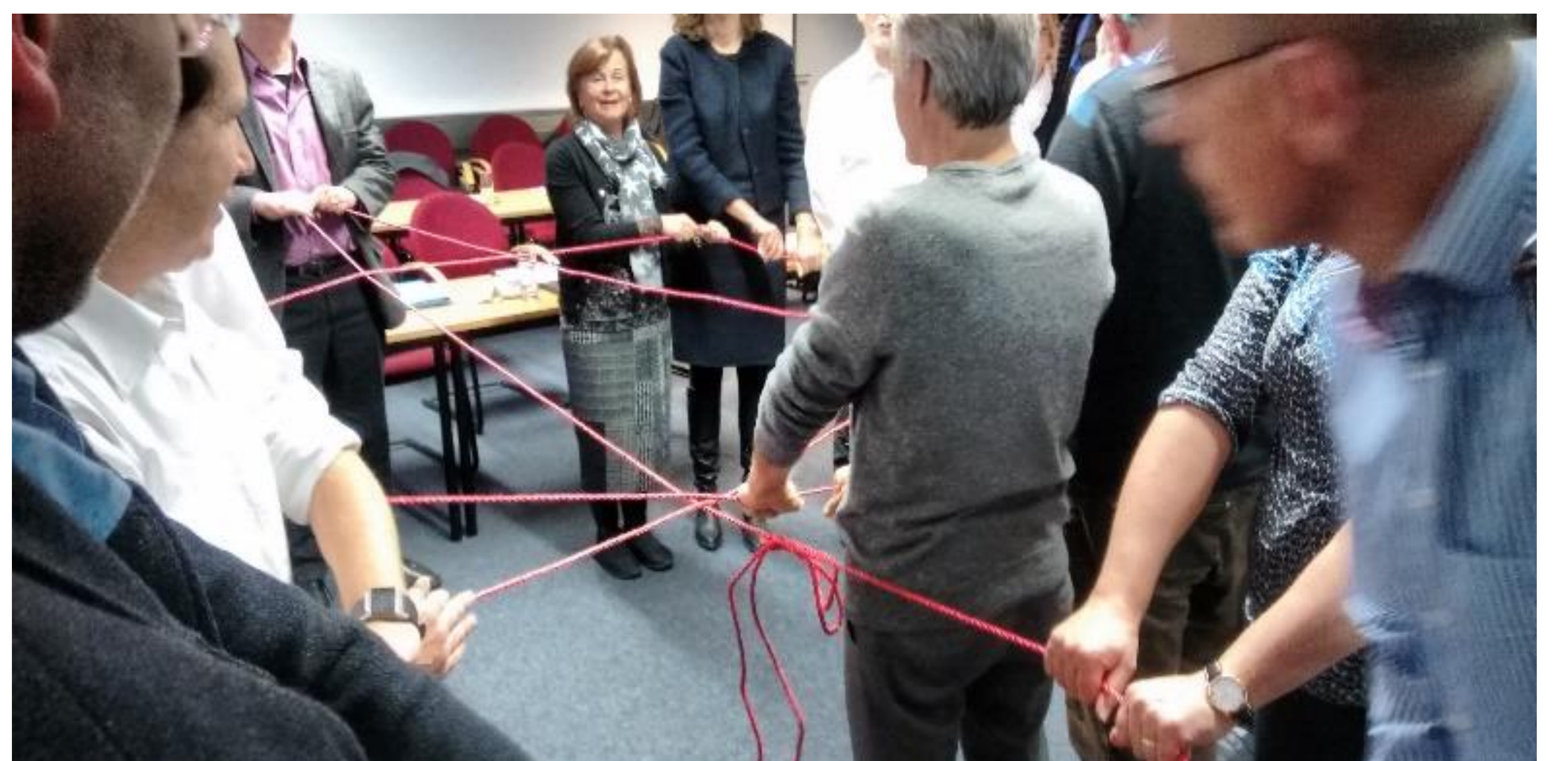
November 2017: HAW Hamburg