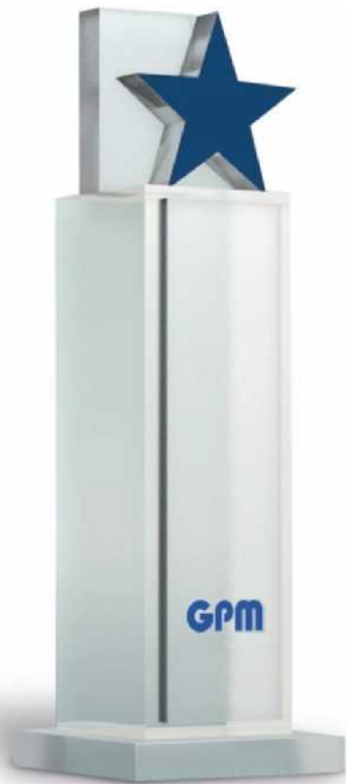
Die Projekt Excellence Award-Trophäe

Es muss da etwas geben, das normale Projekte von außergewöhnlichen unterscheidet. Einen Unterschied zwischen Befriedigung und Begeisterung bei der Zielerreichung. Der Grund, warum von manchen Projekten noch jahrelang erzählt wird, warum sie Startpunkte von Karrieren markieren, Beginn von Freundschaften waren, Unternehmen verändert und markante Spuren in der Gesellschaft hinterlassen haben – und andere Projekte dagegen einfach nur abgewickelt werden.